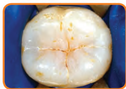
ANTES DEL SELLADOR: la comida y las bacterias quedan atrapadas en las ranuras y hoyos