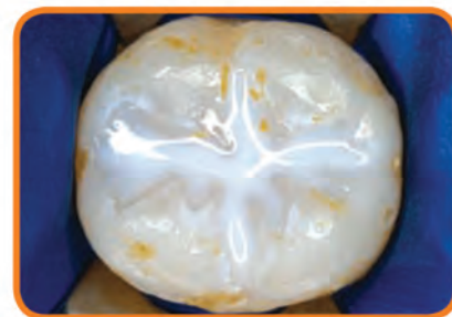
DESPUÉS DEL SELLADOR: las ranuras y hoyos se sellan y se protegen de la comida y las bacterias